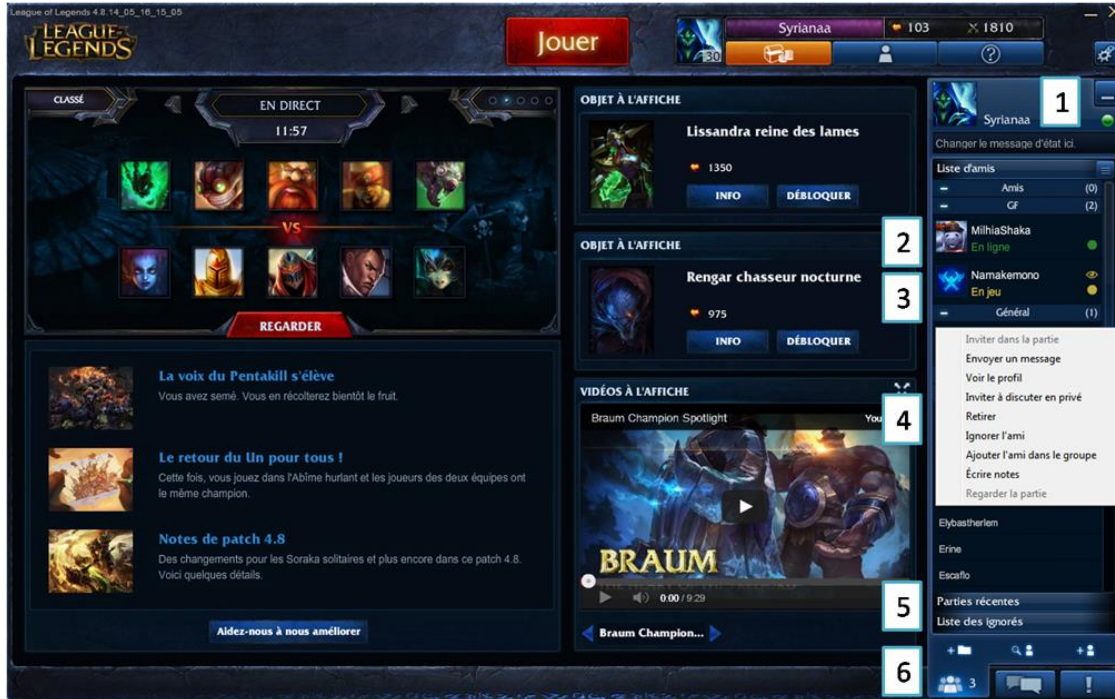
Image 6 : Emplacement de la liste d'amis, dans un volet sur la droite