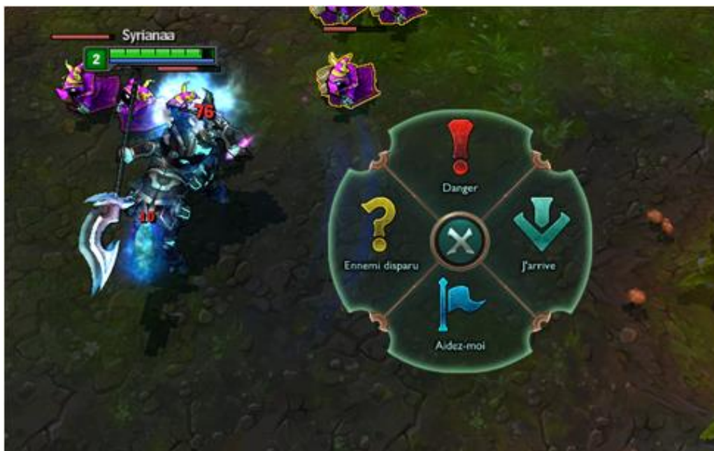
Image 5 : Outils de signalisation durant la partie : flèche pour « j’arrive », point d’exclamation pour « danger », point d’interrogation pour « ennemi disparu », drapeau pour « aidez moi ».

L’écrit semble recréer du relationnel et réintroduire de la distance entre les joueurs, ce qui est rendu plus perceptible pas la simultanéité de l’affichage. On peut distinguer un second outil qui permet de ne pas suspendre par l’écriture de messages l’activité de contrôle du champion qui nécessite déjà l’utilisation du clavier : il consiste à utiliser des symboles associés à un son, permettant de demander de l’aide ou de signaler un danger.