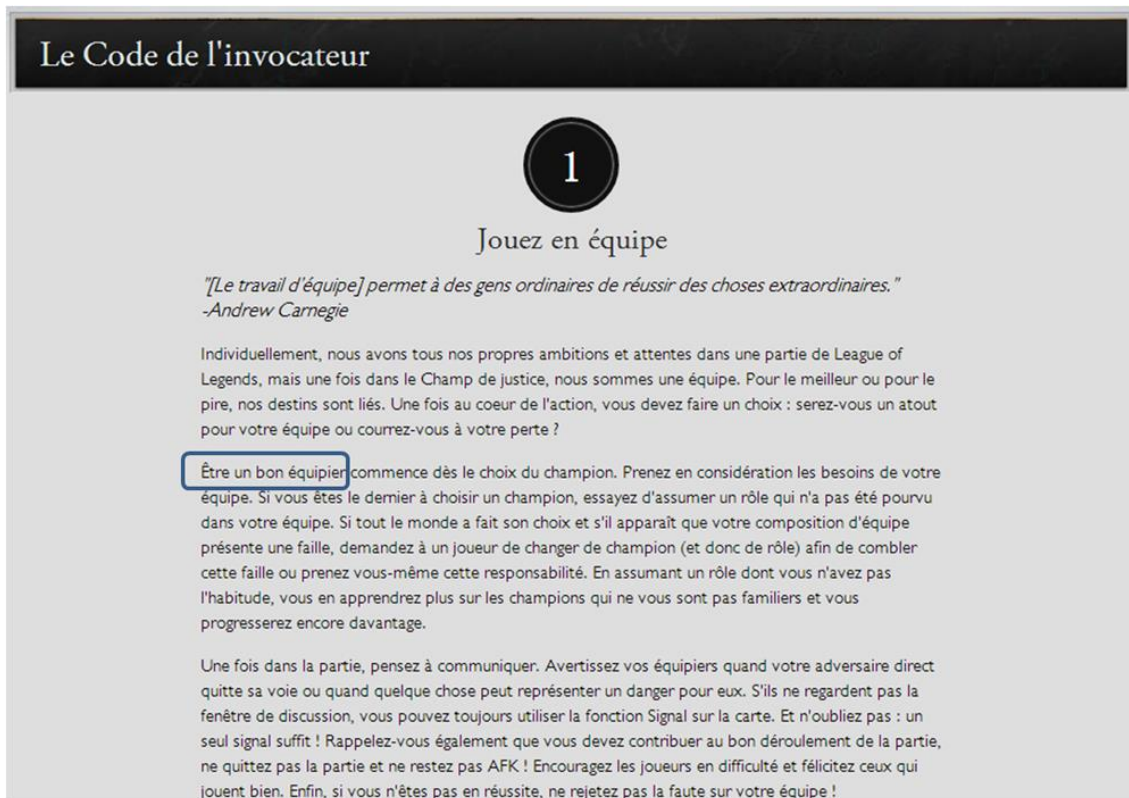
Image 2 : Règle numéro 1 du code de l'invocateur qui introduit la notion de « bon équipier » 4

L'objectif est de voir comment le joueur développe des savoir-faire et fait preuve de réflexivité quant à la situation de communication, afin de négocier sa position et ses relations, en gérant le dispositif qui conditionne ses interactions ainsi que son éthos, déterminant sa pratique socio-relationnelle avec les autres usagers. Je traite dans un premier temps du joueur qui découvre le jeu et fait ses premiers pas en jouant avec des inconnus. Il s'ajuste à la situation, détermine ses possibilités d'action et de communication tout en appréhendant le rôle qu'on lui propose d'endosser. Dans un second temps, il est question de l'amorce des relations et des processus mobilisés lorsque des joueurs décident de jouer ensemble. L'enjeu est de créer une ambiance favorable dans un laps de temps court pour favoriser les chances de victoire, de maîtriser des codes concourant à faire évoluer la relation, et de s'adapter à l'utilisation de la communication vocale. Dans un troisième temps, j'aborde le cas des joueurs se constituant en équipe afin de participer à des parties dites « classées », l'insertion dans un classement permettant une comparaison des compétences collectives avec les autres équipes. L'enjeu confronte les joueurs à la nécessité de gérer leur engagement qui se veut limité, leur éthos respectif, mais aussi de réussir à progresser ensemble et conserver les mêmes objectifs pour faire perdurer la relation.